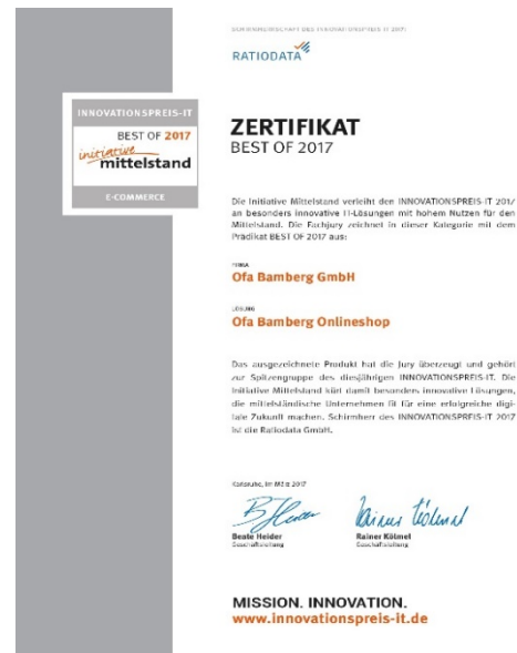
Ofa_Image_126-1: Ausgezeichneter Ofa Bamberg Onlineshop: Die B2B-Plattform zählt zu den 20 „Best of 2017“-Lösungen in der Kategorie E-Commerce.

www.ofa24.de punktete vor allem mit seinem Innovationsgehalt und seinem Nutzen für den Mittelstand. „Die Initiative Mittelstand kürt damit besonders innovative Lösungen, die mittelständische Unternehmen fit für eine erfolgreiche digitale Zukunft machen“, heißt es von Seiten der Ratiodata GmbH, Schirmherrin des Innovationspreises.