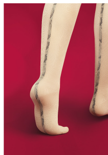
Ofa_Image_54-03: Gefährlich schön – Lastofa Forte in der Farbe Sand kombiniert mit der Schmucknaht Kroko.