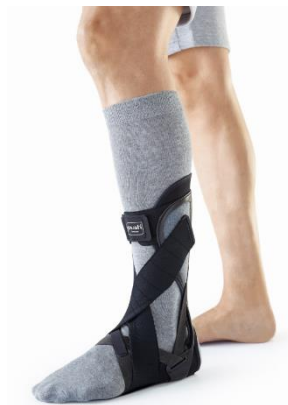
Ofa_Image_107-2: Die Push AFO lässt die Dorsalflexion frei und nutzt die bei vielen Patienten noch intakte Wadenmuskulatur.