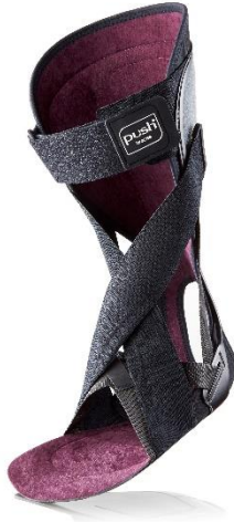
Ofa_Image_107-3: Offene Konstruktion aus fester Schale mit weich gefütterter Softshell und funktionalem Bandsystem.