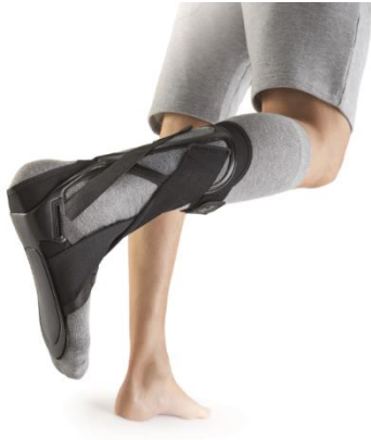
Ofa_Image_107-1: Die neue Push ortho Fußheberorthese AFO von Ofa Bamberg unterstützt den Fallfuß in allen Gangphasen für ein natürliches Gangbild.