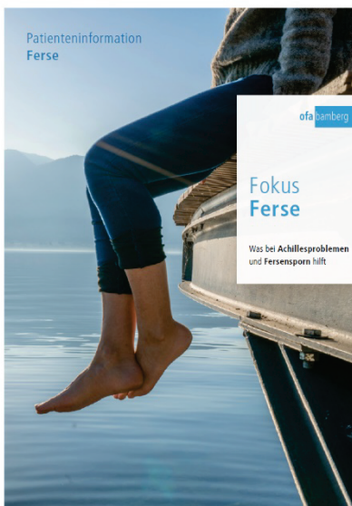
Ofa_Image_14_1_Cover Patienteninformation Fokus Ferse

Um Behandelnde und Betroffene zu unterstützen, bietet Ofa Bamberg neben medizinischen Hilfsmitteln auch praktische Patienteninformationen an. Die neueste Broschüre „Fokus Ferse“ nimmt Achillessehnenprobleme und Fersensporn in den Blick.