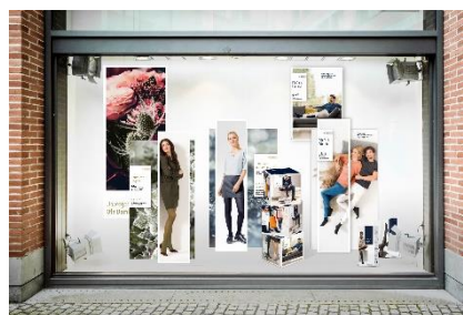
Ofa_Image_438-5 und 6: Die variablen Elemente der Ofa Dekorationen passen perfekt zusammen: Kombinationen von Lastofa und Gilofa links sowie Memory und Gilofa rechts

[Bilder zur freien Verwendung bitte mit Urhebervermerk Ofa Bamberg]