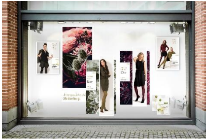
Ofa_Image_338-3: Die ausdrucksstarken Motive der Memory Dekoration ziehen Blicke auf sich.

mit Endverbraucher-Broschüren. Ein tolles Plus ist das Detail-Poster für die Kabine. Es erläutert alle komfortablen Neuerungen auf einen Blick.