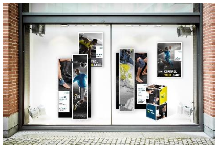
Ofa_Image_138-1: Die dynamische Push Sports Deko im Schaufenster

Seit August ist die neue Bandagenlinie Push Sports im Fachhandel erhältlich. Die Spezialbandagen bieten volle medizinische Wirksamkeit und sind dabei gleichzeitig zugeschnitten auf sportliche Dynamik. Auch die Dekorationen für Push Sports setzen dynamische, knallige Akzente und sorgen für Aufmerksamkeit. Das Dekorationspaket besteht aus zwei Postern, einem Display sowie zwei Dekowürfeln. Die Motive zeigen verschiedene Sportler in Aktion und strahlen vor Energie. So locken sie gerade die Zielgruppe der Sportler an, die für Sanitätshäuser oft Neukunden sind.