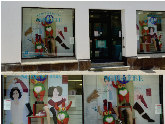
Ofa_Image_24-1: Einer der Sieger des Ofa Schaufenster Wettbewerbs 2020: das Sanitätshaus Schäfer in Usingen.