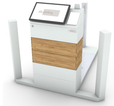
Ofa Image_7-1: Der neue Ofa Smart Scan besitzt zwei integrierte Schubladen – hier im Dekor Eiche.

Zudem können die Messdaten in diverse Warenwirtschaftssysteme exportiert oder per PDF und E-Mail versendet werden – natürlich datenschutzkonform. So können Produkte auch unabhängig vom Hersteller bestellt werden.